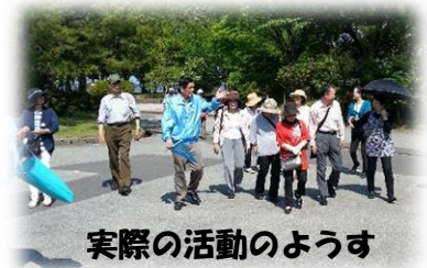
実際の活動のようす