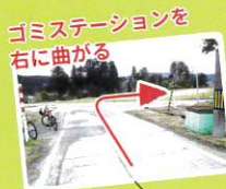
ゴミステーションを 右に曲がる