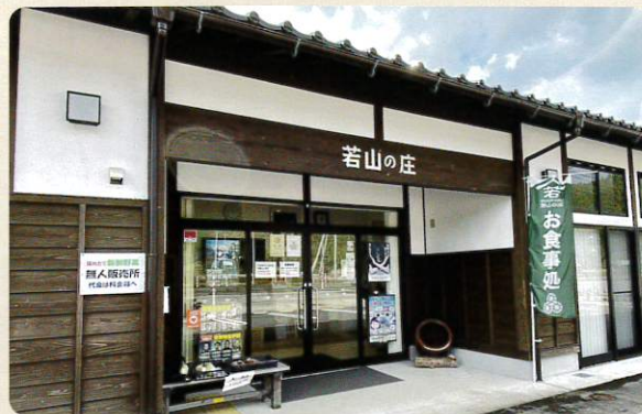
住所：若山町延武い部 40-1 ☎0768-82-1800 定休日：毎週水曜日

珠洲市若山町は珠洲市内でも、米の名産地として知られたところ。近所のお母さん方が運営する「お母さん食堂」ではそのお米を使った食事が味わえます。また、珠洲市では祭礼時に親戚などを家に招待し御膳で旬のごちそうをふるまう「よばれ」の風習があります。その「よばれ」御膳を再現した、「珠洲まつり御膳」を味わうことができます（要予約）。売店では、若山のお米、地物野菜などを主に、農産物を販売しています。秋には、松茸も姿を見せますよ。