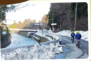
川のせせらぎを聞きながら快走