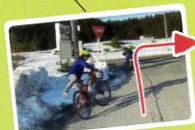
国道に突き当たったら 右折