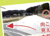
向こうに神社が 見えてきたら 左脇道へ入る