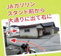
JAガソリン スタンド前から 大通りに出て右に